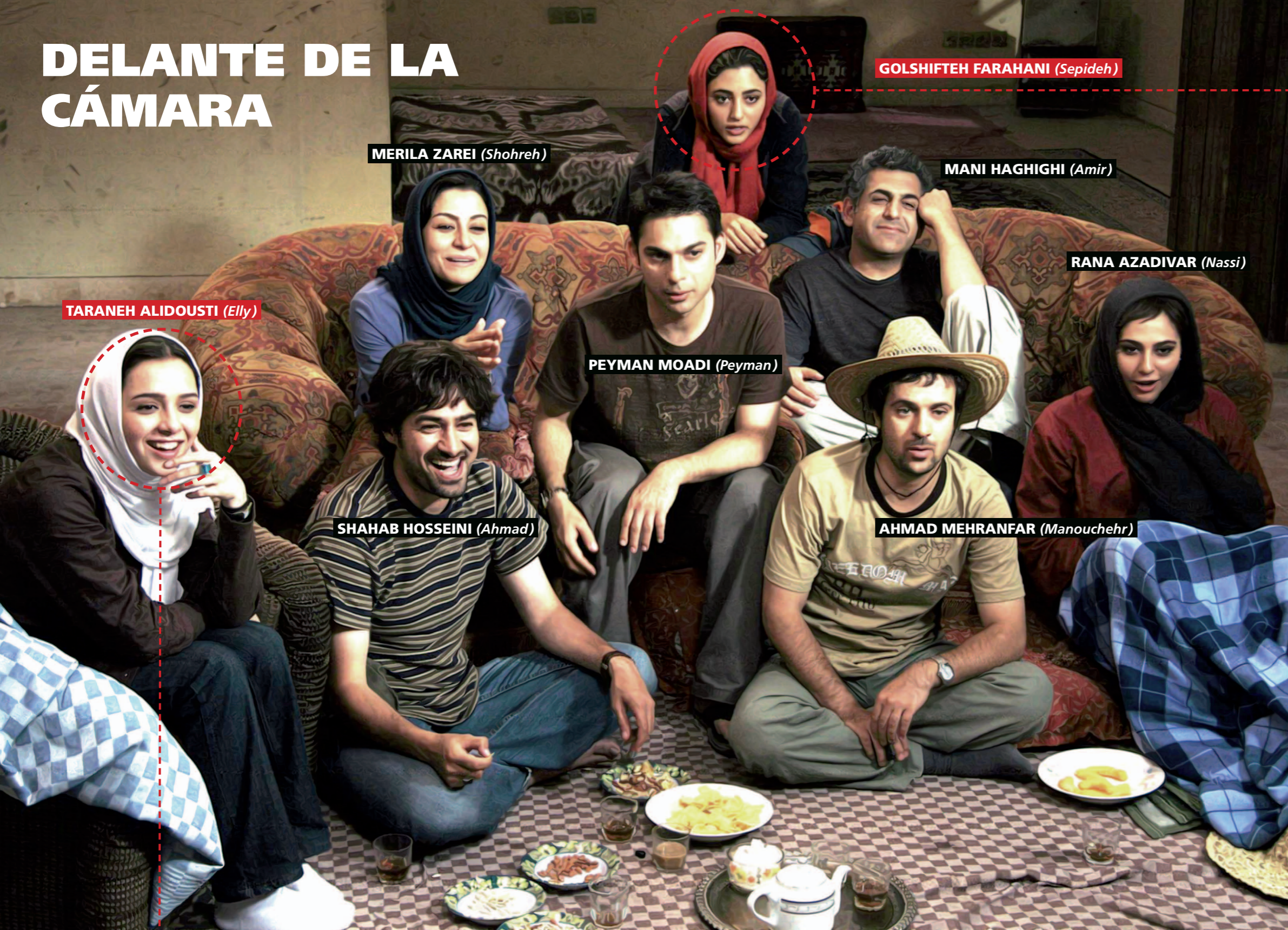
TARANEH ALIDOUSTI ( Elly )