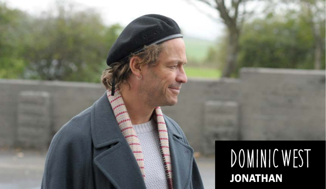
DOMINIC WEST JONATHAN

Trabaja en cine, televisión y teatro tanto en Inglaterra como en Estados Unidos. Debutó en la gran pantalla en RICARDO III, de Richard Loncraine, en 1995. Desde entonces ha tenido papeles protagonistas en películas como CHICAGO, de Rob Marshall; STAR WARS: EPISODIO I – LA AMENAZA FANTASMA, de George Lucas; SOBREVIVIR A PICASSO, de James Ivory; HANNIBAL, EL ORIGEN DEL MAL, de Peter Webber; 28 DÍAS, de Betty Thomas; LA SONRISA DE MONA LISA, de Mike Newell; MISTERIOSA OBSESIÓN, de Joseph Ruben; 300, de Zack Snyder, y JOHN CARTER, de Andrew Stanton, entre otras.