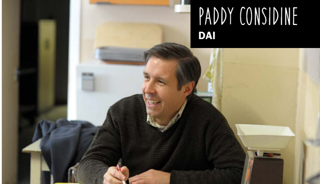
PADDY CONSIDINE DAI

Trabaja en cine, televisión y teatro tanto en Inglaterra como en Estados Unidos. Debutó en la gran pantalla en RICARDO III, de Richard Loncraine, en 1995. Desde entonces ha tenido papeles protagonistas en películas como CHICAGO, de Rob Marshall; STAR WARS: EPISODIO I – LA AMENAZA FANTASMA, de George Lucas; SOBREVIVIR A PICASSO, de James Ivory; HANNIBAL, EL ORIGEN DEL MAL, de Peter Webber; 28 DÍAS, de Betty Thomas; LA SONRISA DE MONA LISA, de Mike Newell; MISTERIOSA OBSESIÓN, de Joseph Ruben; 300, de Zack Snyder, y JOHN CARTER, de Andrew Stanton, entre otras.