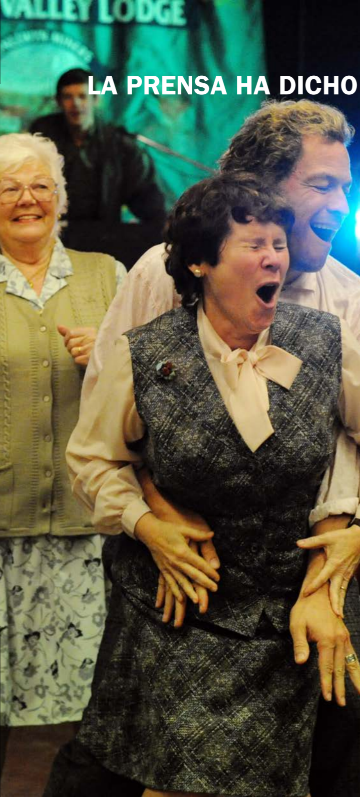
LA PRENSA HA DICHO

Se inscribió en un curso de Arte Dramático en el Burton College y allí conoció al director Shane Meadows, con el que fundó un grupo llamado “She Talks to Angels”, donde tocaba la batería. Ninguno de los dos acabó el curso, y Paddy Considine empezó a estudiar Fotografía en la Universidad de Brighton. Al terminar sus estudios trabajó en un cortometraje dirigido por su amigo Shane Meadows. A continuación, este le ofreció el papel principal en la película A ROOM FOR ROMEO BRASS. Al año siguiente (2000) trabajó en LAST RESORT, de Pawel Pawlikowski. Otras películas suyas son EN AMERICA, de Jim Sheridan; 24 HOUR PARTY PEOPLE, de Michael Winterbottom; CINDERELLA MAN, EL HOMBRE QUE NO SE DEJÓ TUMBAR, de Ron Howard; HOT FUZZ/ARMA FATAL, de Edgar Wright; EL ULTIMÁTUM DE BOURNE, de Paul Greengrass.